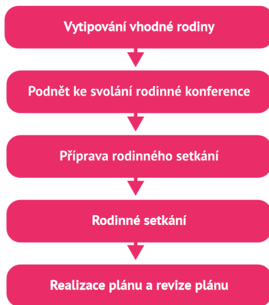
Obrázek 1 Proces rodinné konference

Proces rodinné konference má několik jasně vymezených fází, které znázorňuje následující obrázek 1 (Jirásek, a další, 2015 s. 25)